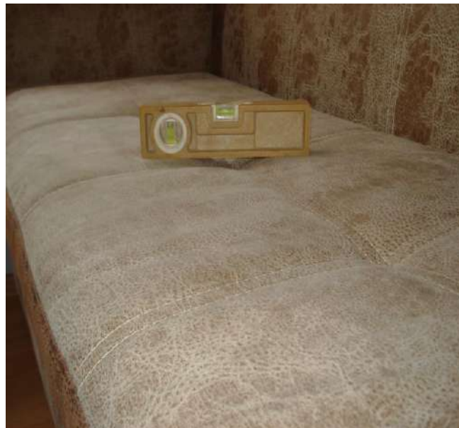
Фото 8. Фотофиксация проверки горизонтальности деталей и узлов дивана мод. «Марсель».