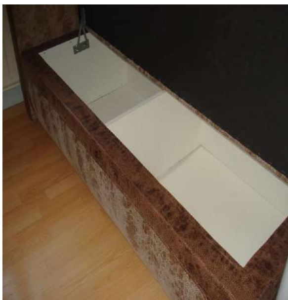
Фото 3. Общий вид ящиков дивана мод. «Марсель».