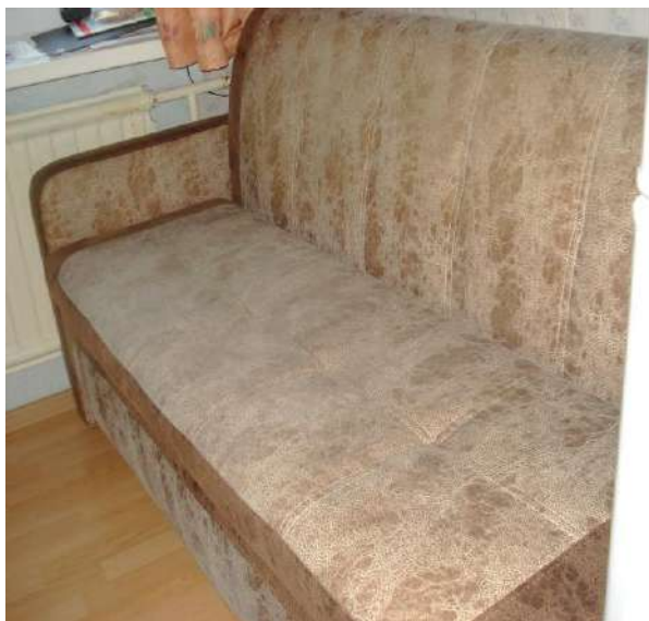
Фото 1. Общий вид дивана мод. «Марсель».