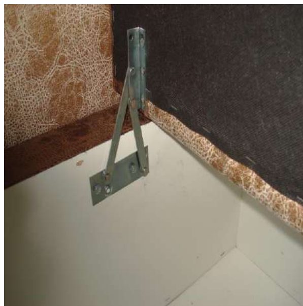
Фото 4. Общий вид механизма подъема сиденья дивана мод. «Марсель».