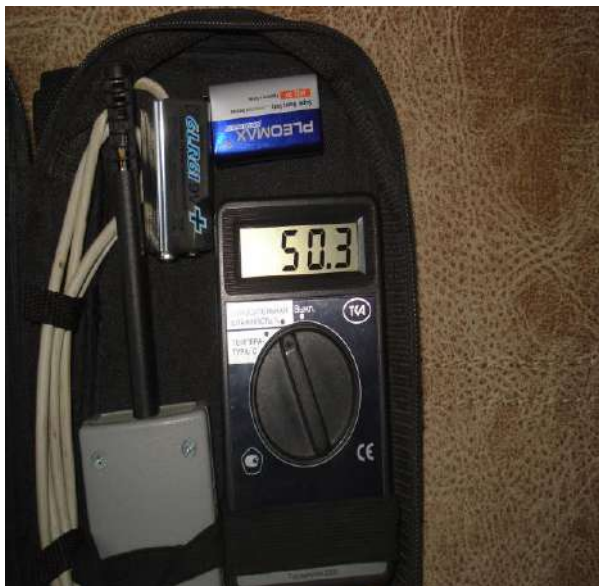
Фото 5. Фотофиксация «климат-контроля»: показатель относительной влажности воздуха в помещении установки дивана мод. «Марсель».