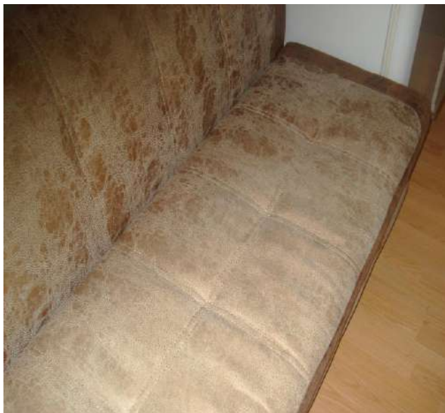
Фото 7. Общий вид потертости поверхности сидения дивана мод. «Марсель».