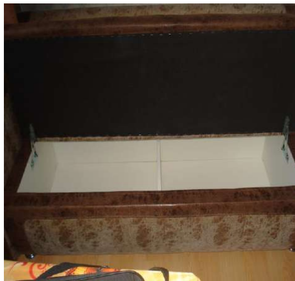
Фото 2. Общий вид дивана мод. «Марсель» с открытым сидением.