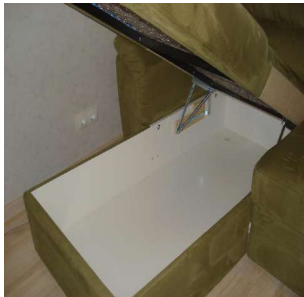
Фото 6. Общий вид ящика для постельных принадлежностей углового дивана-кровати мод. «Атлантик».