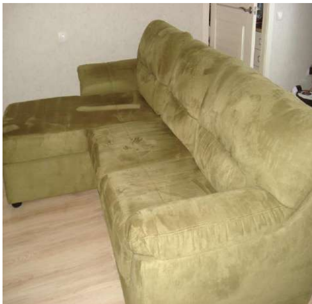
Фото 1. Общий вид углового дивана-кровати мод. «Атлантик» в положении «диван».