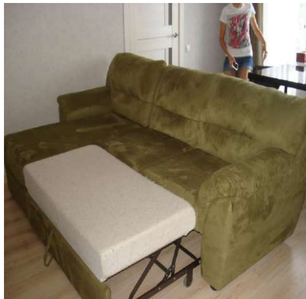
Фото 2. Общий вид углового дивана-кровати мод. «Атлантик» в положении «кровать».