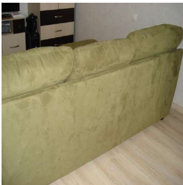
Фото 3. Общий вид сзади углового дивана-кровати мод. «Атлантик».