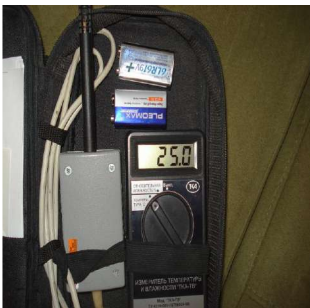
Фото 7. Фотофиксация показателя температуры в помещении установки углового дивана-кровати мод. «Атлантик».