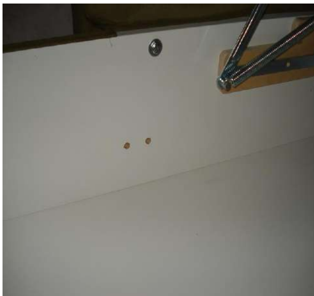
Фото 5. Общий вид технологических отверстий на стенке ящика углового дивана-кровати мод. «Атлантик».