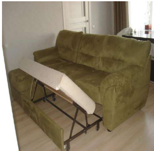
Фото 4. Общий вид механизма трансформации углового дивана-кровати мод. «Атлантик».